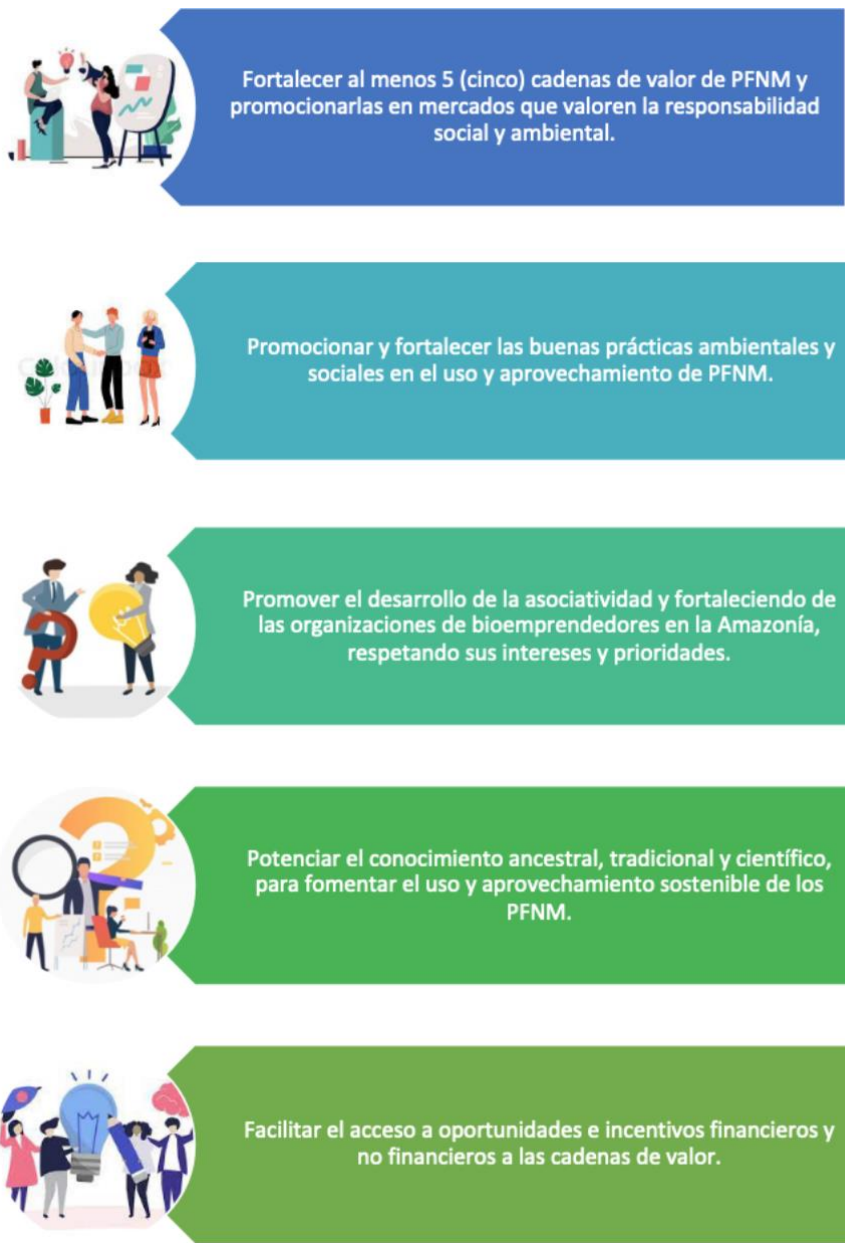
Figura N° 5 Objetivos estratégicos de la Mesa de PFSM (2021 – 2025)

Los problemas críticos encontrados incluyen: