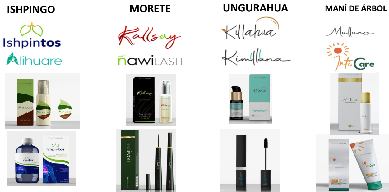
Figura N° 3 Productos diseñados a partir de los ingredientes naturales perfilados