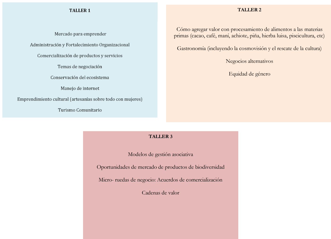
Figura N° 6