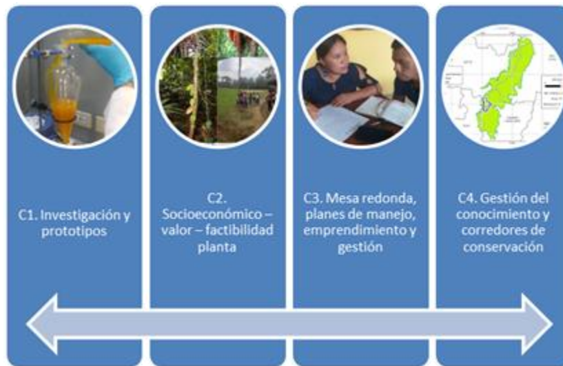
Figura N° 1 Componentes del proyecto PROAmazonía – UTPL

obtenidos y establecer experiencias, aprendizajes y oportunidades, retos y barreras en la implementación de alternativas sostenibles a partir de la biodiversidad.