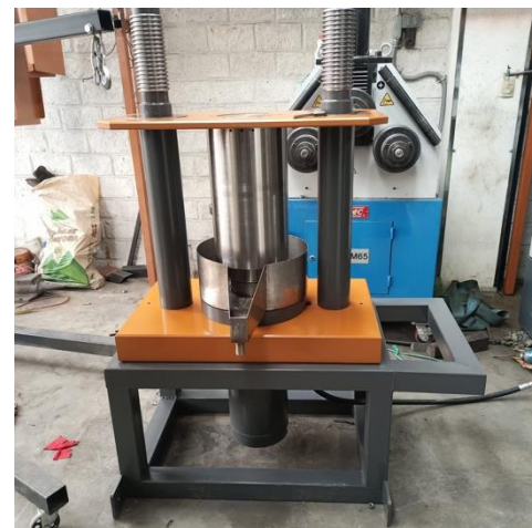
Figura N° 4 Diseño del proceso para extracción de aceite vegetal en frío de M. flexuosa en la comunidad de Mashumarentza y prensa de extracción